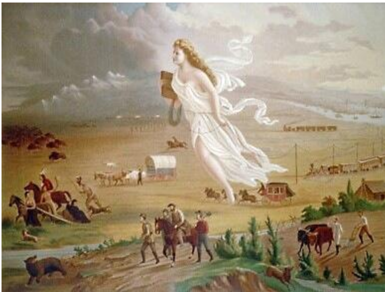
Картина Джона Гэста «Американский прогресс» (1872 г.), изображающая Колумбию (символ США, предшественница «дяди Сэма»), прогоняющую индейцев с их земель во имя продвижения цивилизации на Запад.

Некоторые аспекты геноцида коренного населения нашли своё отражение и в искусстве США. Ниже представлена картина Джона Гэста «Американский прогресс». Обратим внимание на два обстоятельства: